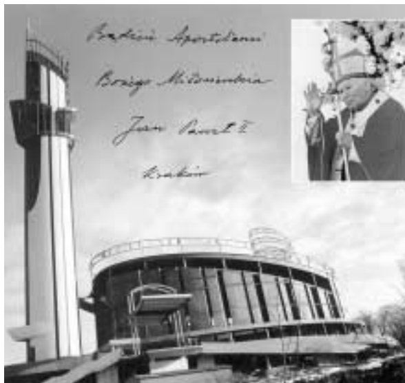
Dar Boga dla całego świata

Wiarę otrzymujemy od Boga, a Bóg posługuje się ludźmi, aby obdarzyć nas swoim zbawieniem, po to dał nam Kościół, a w nim Maryję Matkę i Samego Siebie. Bez wiary nasze życie byłoby niepojęte. Małe dziecko wierzy swoim rodzicom, dlatego może wzrastać w pokoju i bezpieczeństwie, może się rzucać w ra-