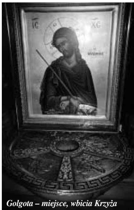
Golgota – miejsce, wbicia Krzyża

Otwórzcie wasze serca, kochane dzieci, szczególnie teraz, w tym czasie łaski, i okaǳcie swoją miłość Ukrzyżowanemu. Zaproszenie jest jasne i jednoznaczne: nie jesteśmy wezwani do jakiegoś zewnętrznego gestu czy aktu poboż-