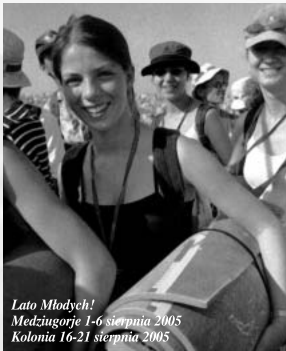
Lato Młodych! Medziugorje 1-6 sierpnia 2005 Kolonja 16-21 sierpnia 2005

Kiedy się modlicie, wasze serce jest otwarte, a Bóg kocha was szczególną miłością i daje wam szczególne łaski.