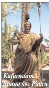
Kafarnaum. Statua św. Piotra

I tobie dam klucze królestwa niebieskiego; cokolwiek zwiążesz na ziemi, będzie związane w niebie, a co rozwiążesz na ziemi, będzie rozwiązane w niebie. Uczniowie Jezusa stanowią wspólnotę pierwotnego Kościoła, która w mocy Ducha Świętego otrzymuje misję kontynuowania dzieła Syna na ziemi.