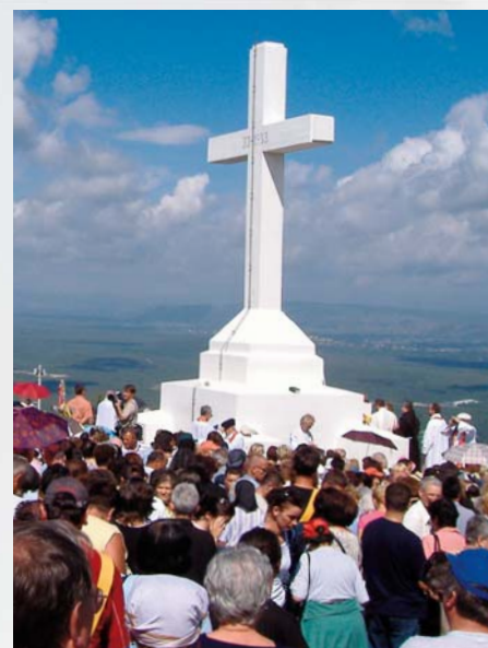
A Ja, gdy zostanę nad ziemię wywyższony, przyciągnę wszystkich do siebie (J 12, 32).

„Wielu pielgrzymów, nawet kapłanów, nie rozumie dlaczego Matka Boża przychodzi codziennie , co mogłaby mi mówić każdego dnia i co ja mógłbym mówić Jej. Muszę wam powiedzieć, że dużo rozmawiamy! Pewnego dnia, gdy rzeczy zostaną ujawnione zrozumiecie, otworzą