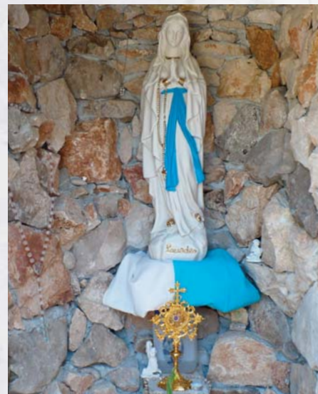
Relikwie bł. Jana Pawła II w kaplicy różańcowej Polskiej Oazy w Medziugorju

Jestem z wami i wstawiam się za wami wszystkimi u Boga, aby wasza wiara była zawsze żywa, radosna i pełna miłości Bożej.