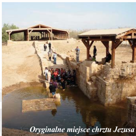
Oryginalne miejsce chrztu Jezusa

Przeżywać Boże Narodzenie , to nie znaczy wziąć udział w jakimś nabożeństwie, ulegać urokowi bożonarodzeniowego nastroju, to nie znaczy zrobić coś więcej, ani lepiej, niż wczoraj. Jezus przychodzi do ludzi: albo się Go przyjmuje, albo się Go odrzuca – nie ma dróg pośrednich.