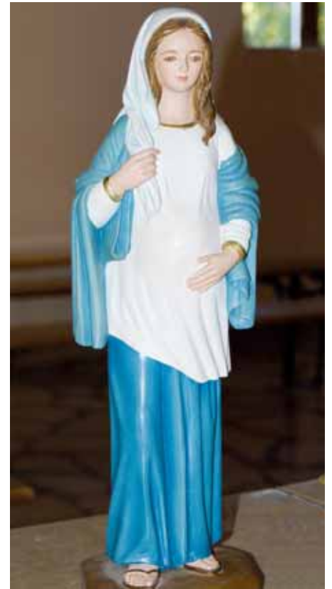
Niosę wam Zbawiciela