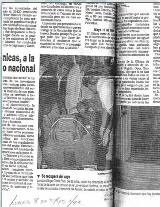
Zdjęcie i artykuł o wypadku z uderzeniem pioruna w dzienniku „Espectador” z 8 maja 1995 r. – na zdjęciu pani Polo podczas odtransportowania do szpitala