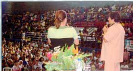
Pani Polo w Brazylii – luty 2008