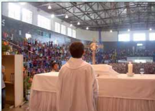
Pani Polo w Brazylii – luty 2008